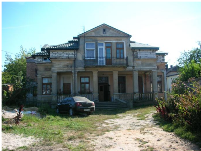
Haus am Bahnhof