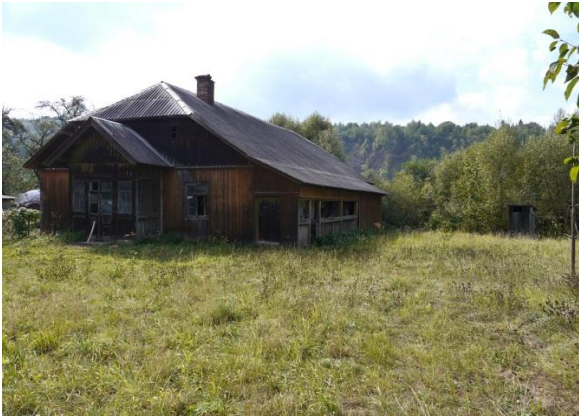
Die Mosmann-Muehle – Aussenansicht (I)