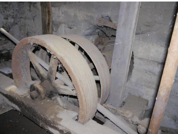
Muehle – Werkraume (Untergeschoss)

Die Mühle ist nicht mehr bewohnt, befindet sich aber in einem begehbaren Zustand. Die Werkräume befanden sich im hinteren Teil des Hauses. Mühlsteine und Teile der Gerätschaften sind noch vorhanden. Im vorderen Teil lagen die ehemaligen Wohnräume, die jetzt als Lagerschuppen dienen.