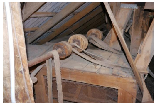
Muehle - Werkraume (Dachgeschoss)