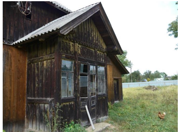
Die Mosmann-Muehle – Aussenansicht (II)