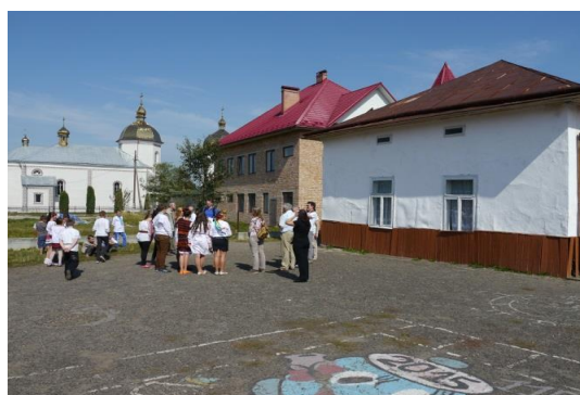
Die Schule von Kniazoluka

Zentral im Ort liegt das Haus der Gemeindeverwaltung. Dort befindet sich auch die Bibliothek, in der sich in einer Ecke ein kleines Museum mit lokalen Tucherzeugnissen befindet. Moderne Computerarbeitsplätze mit Webcam sind auch verfügbar.