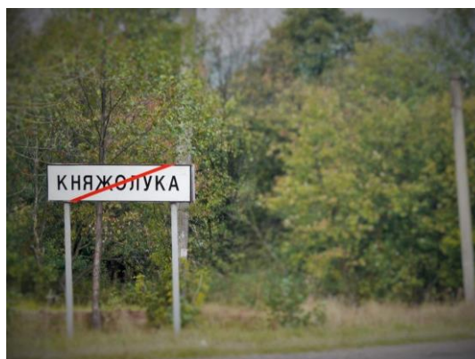
Schild am Ortsausgang