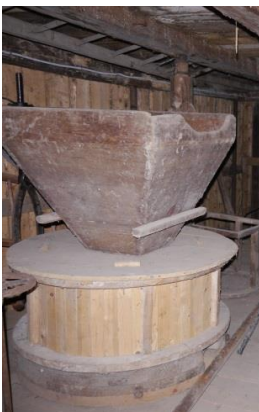
Muehle – Werkraume Erdgeschoss