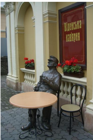
Man sieht viele Statuen in der Stadt