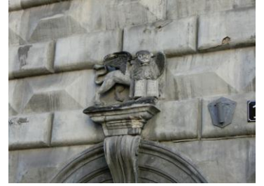
Markuslöwe an einer Hausfassade am Marktplatz