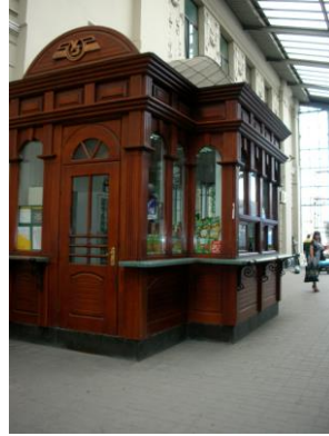
Kiosk in der Bahnhofshalle