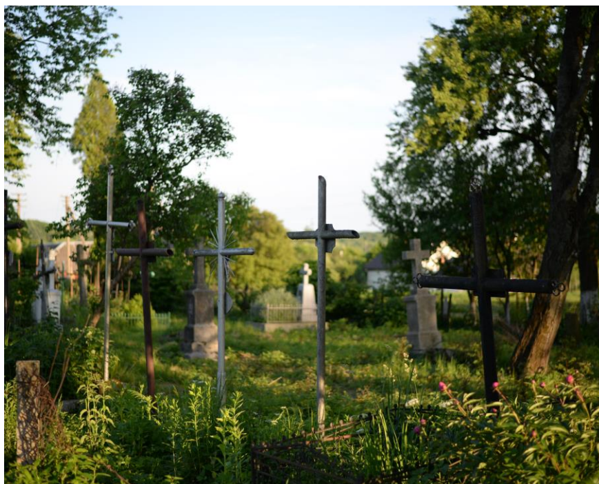
Bilder vom alten Friedhof