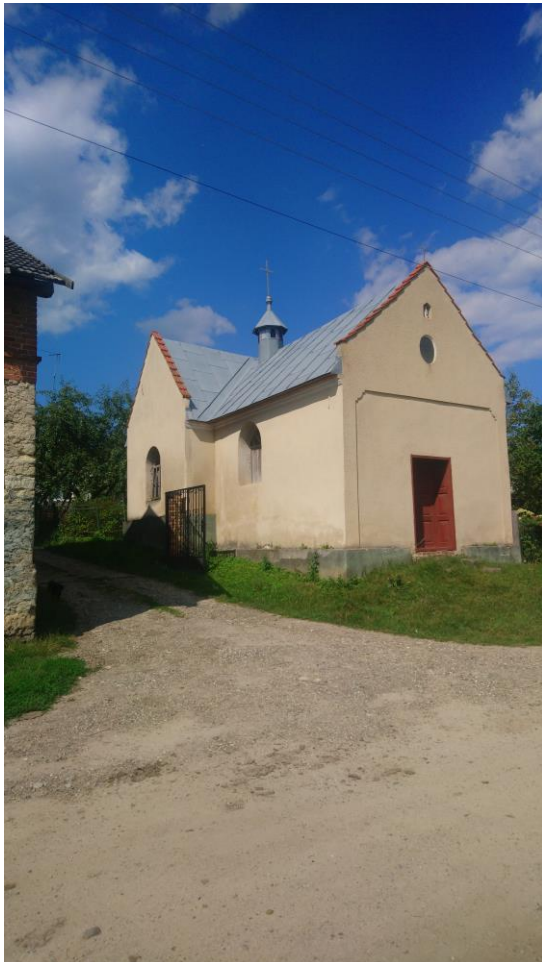
Alte römisch-kath. Kapelle

Erhalten sind nur noch wenige Wohnhäuser sowie die ehemalige römisch-katholische Kapelle, diese ist jedoch in einem sehr schlechten Zustand. In der sowjetischen Zeit waren hier Chemikalien gelagert worden, die das Kircheninnere stark in Mitleidenschaft gezogen haben. Der Innenraum des Gebäudes ist abgestützt; der Wiederaufbau evtl. durch einen Sponsor möglich.