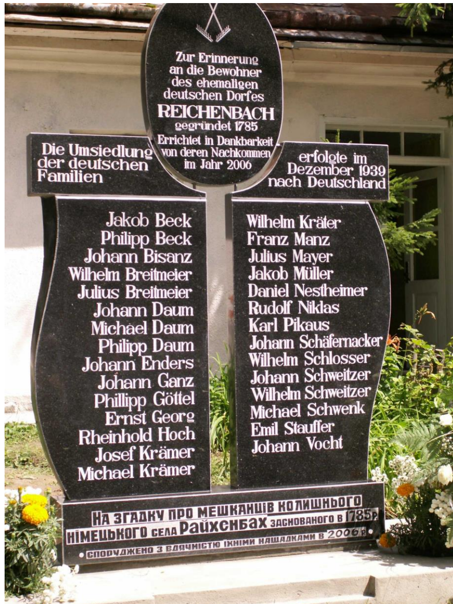
Gedenkstein im ehemaligen Reichenbach, errichtet von den Nachkommen im Jahre 2006