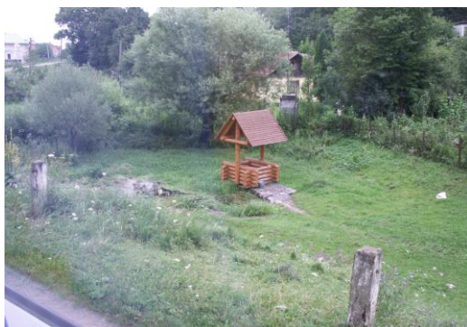
Neuer Brunnen an alter Stelle