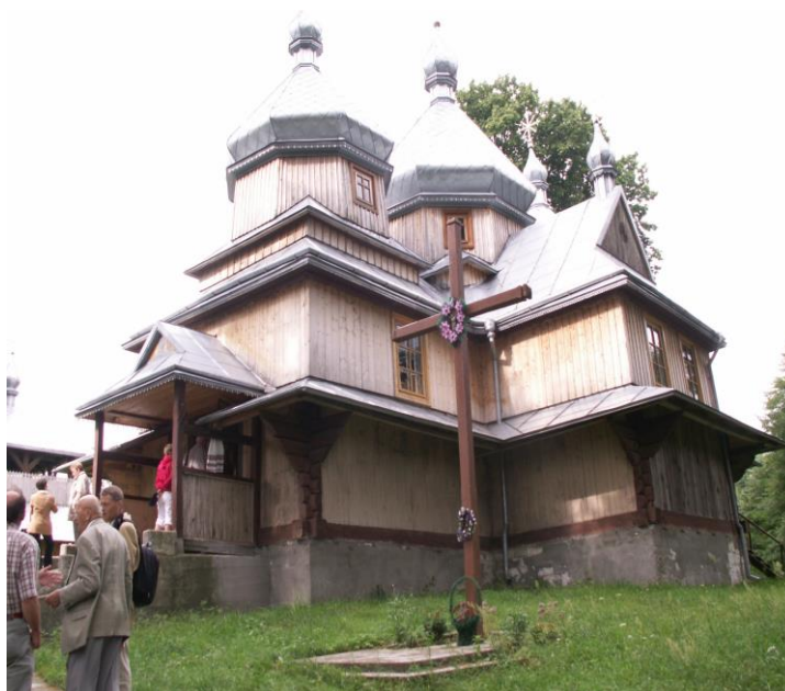
Neue griechisch-katholische Kirche