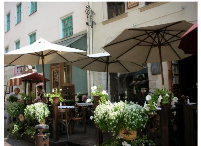
Markt in der Stadt