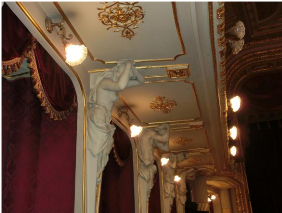
Blick in das Opernhaus