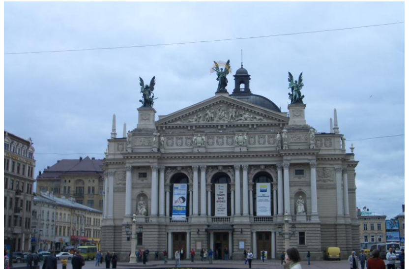
Das Opernhaus, 1901 erbaut