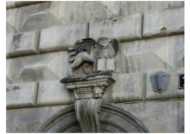
Markuslöwe an einer Hausfassade am Marktplatz