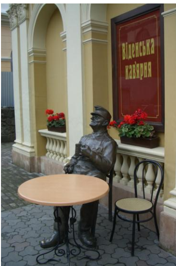
Man sieht viele Statuen in der Stadt