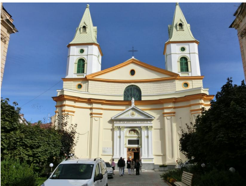
Die frühere ev. Kirche, heute Gotteshaus der Baptisten