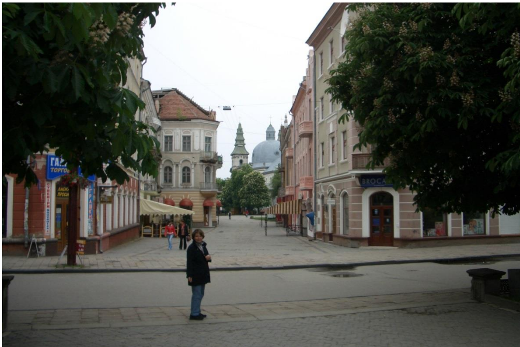
Blick in die Innenstadt